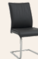
Schwingstuhl mit Matte in Sitz und Rücken