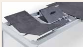
Zwei Klappeinlagen à 45 cm 140(230)x90 cm 160(250)x90 cm 180(270)x90 cm