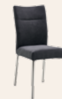
Stuhl 4-Fußgestell * Gestell Quadratrohr