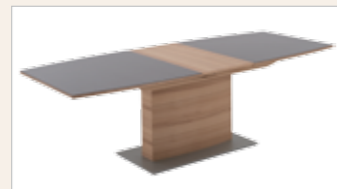
Eine massive Einlegeplatte 45 cm 160(205)x95 cm 180(225)x95 cm