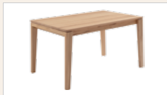
Feste Platte 140/160/180x90 cm 160/180/200x100 cm

4-FUSS-TISCHE fest oder ausziehbar mit Gestellauszug, Gestell Massivholz mit einer Dickschicht Edelfurnier oder weiß lackiert