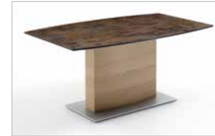
Säulentisch in Bootsform optional mit Einlegeplatte 45 cm