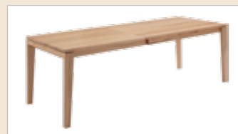
140(230/240)x90 cm 160(250/260)x90 cm 180(270/280)x90 cm