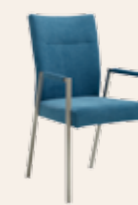
Armlehnen-Stuhl 4-Fußgestell * Gestell Quadratrohr