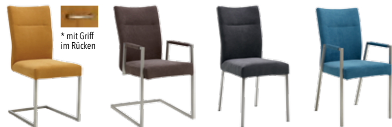
Schwingstuhl * Gestell Quadratrohr