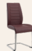
Schwingstuhl mit Design-Steppung