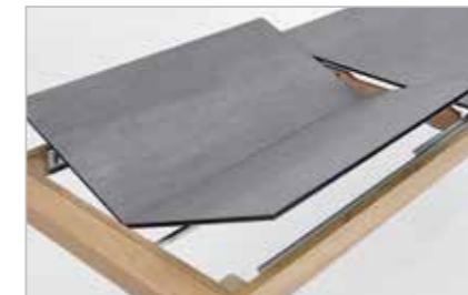
Gestellauszug mit 1 Klappeinlage 100 cm