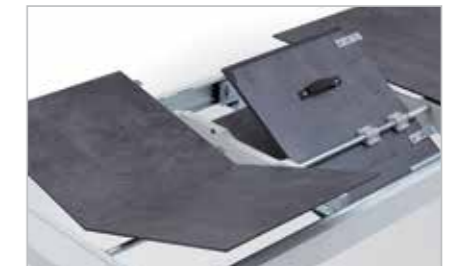
Gestellauszug mit 2 Klappeinlagen à 45 cm

MONDO QBIS bietet elegante Säulentische sowie klassische 4-Fußtische, wahlweise mit fester Platte oder mit Mittel- bzw. Gestellauszug. Dank neuester Beschlagtechnik lassen sich die Auszugsfunktionen komfortabel bedienen. Maximal wird eine Tischlänge von bis zu drei Metern erreicht.