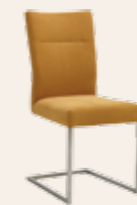
Schwingstuhl * Gestell Quadratrohr