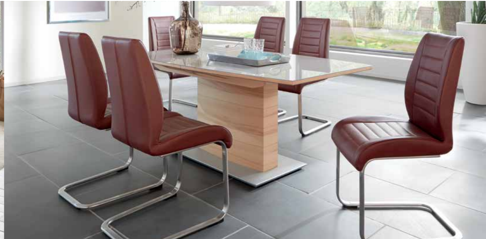
Säulentisch , Gestell Kernbuche furniert, Tischplatte Glas Taupe lackiert, 180 x 90 cm. Schwingstühle aus der umfangreichen Stuhlkollektion.

4-FUSS-TISCHE fest oder ausziehbar mit Gestellauszug, Gestell Massivholz mit einer Dickschicht Edelfurnier oder weiß lackiert