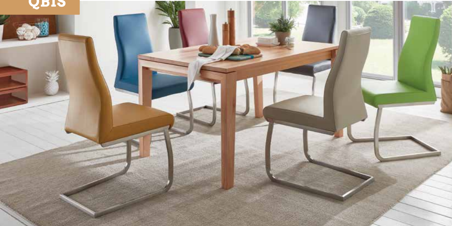
4-Fuß-Tisch , Gestell Kernbuche, Tischplatte Massivholz Kernbuche, 140 x 90 cm. Schwingstühle aus der umfangreichen Stuhlkollektion.