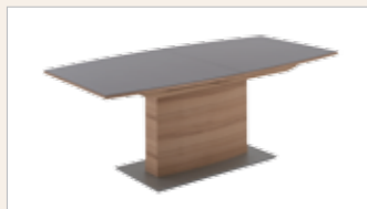
Feste Platte 160x95 cm 180x95 cm

SÄULENTISCHE bootsförmig, fest oder ausziehbar mit Mittelauszug, Gestell Holz furniert oder weiß lackiert