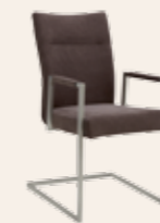
Armlehnen-Schwingstuhl * Gestell Quadratrohr