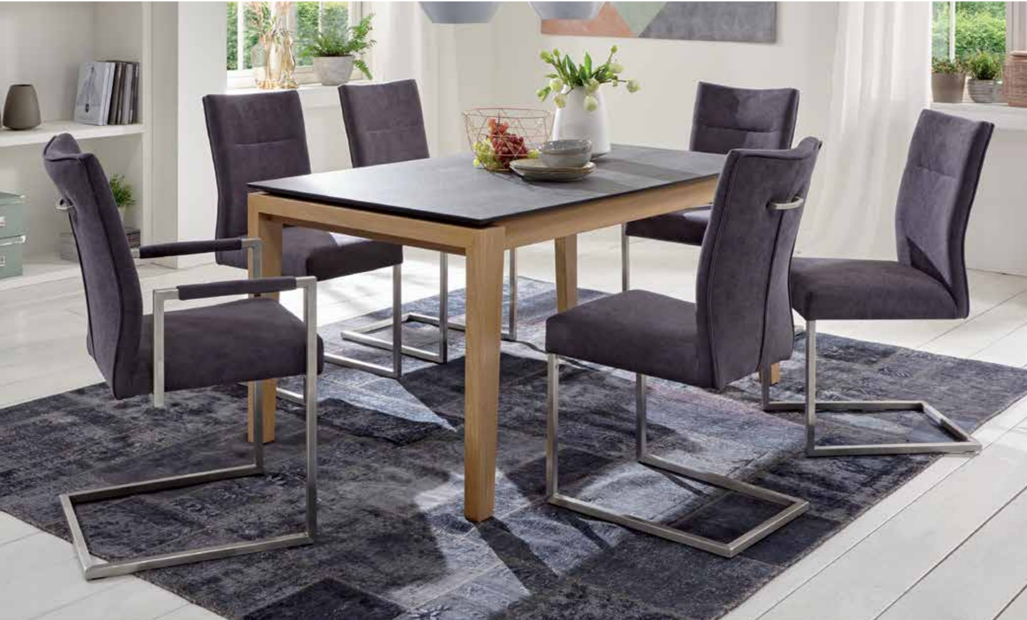
4-Fuß-Tisch, Gestell Eiche Bianco, Tischplatte Keramik Rock Anthrazit, 160 x 90 cm. Schwingstühle aus der umfangreichen Stuhlkollektion.