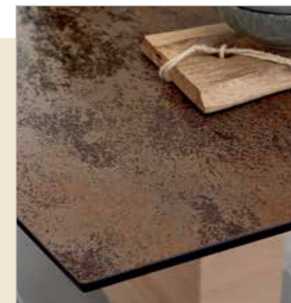
Tischplatte erhältlich in HPL Reliefoberfläche, Keramik, Glasplatte oder Massivholz

MONDO QBIS bietet elegante Säulentische sowie klassische 4-Fußtische, wahlweise mit fester Platte oder mit Mittel- bzw. Gestellauszug. Dank neuester Beschlagtechnik lassen sich die Auszugsfunktionen komfortabel bedienen. Maximal wird eine Tischlänge von bis zu drei Metern erreicht.