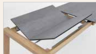
Eine Klappeinlage 100 cm 140(240)x90 cm 160(260)x90 cm 180(280)x90 cm 160(250)x100 cm 180(270)x100 cm 200(290)x100 cm

SÄULENTISCHE bootsförmig, fest oder ausziehbar mit Mittelauszug, Gestell Holz furniert oder weiß lackiert